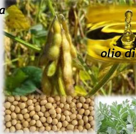
olio di soia